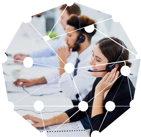
销售人员/招生老师